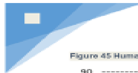
Figure 45 Human capital dimension (Score 0-100), 2019